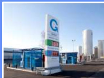
Suunnitteilla olevia Gasumin tankkausasemia (tulevat asemat tarkemmin Gasumin nettisivuilla)